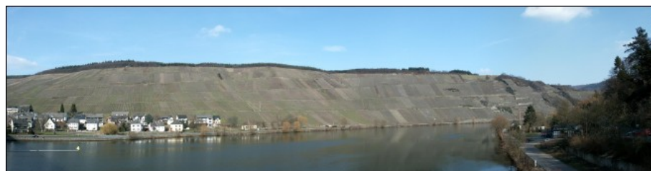
Panorama-Blick über den "Wangert" (Weinberg) bei Mehring an der Mosel

Aus allen deutschen Weinbaugebieten und aus den ehemals deutschsprachigen Weinbauregionen in West-, Mittel-, Südost- und Osteuropa (z. B. in Lothringen, Südtirol, Rumänien, Ungarn, Polen, Tschechien, Slowenien, Kroatien, Serbien-Montenegro, Russland, Aserbaidschan,